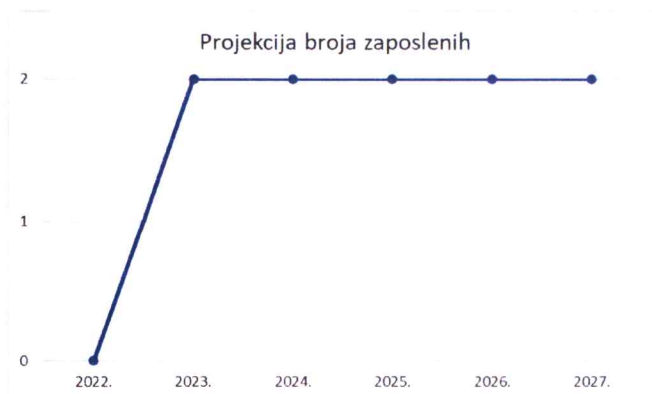
Grafikon 1 Plan kretanja broja zaposlenih po godinama

Planirano kretanje broja zaposlenih prikazano je grafičkim prikazom u nastavku, a odnosi se na period od 2022. g. - 2027. g. Grafički prikaz prikazuje povećanje broja zaposlenih u odnosu na prethodne godine (prosječan broj zaposlenih) što je rezultat restrukturiranja tvrtke i povećanja prodaje do kojeg je došlo kroz projekciju budućeg poslovanja tvrtke.